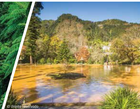
Park Terra Nostra