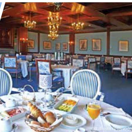
Banhos da Ferraria