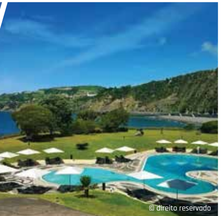
Hotel Pestana Bahia Praia