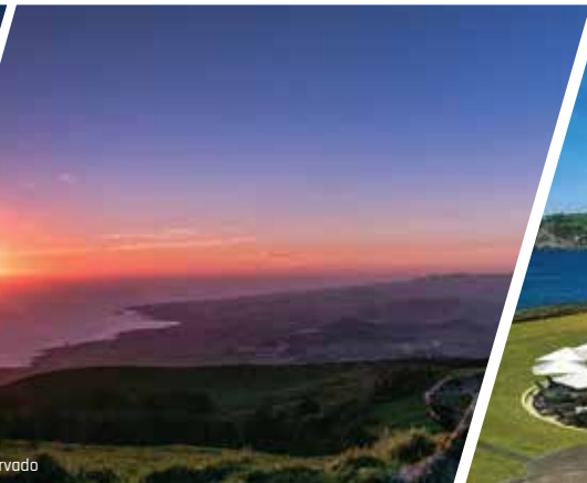
Sunset S. Miguel